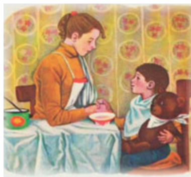
Н. Седулина. Иллюстрация к рассказу В. Драгунского «Друг детства»

А я не знал, что со мной, я долго молчал и отвернулся от мамы, чтобы она не догадалась, что со мной, и я задрал голову к потолку, чтобы слёзы вкатились обратно, и потом, когда я скрепился немного, я сказал: