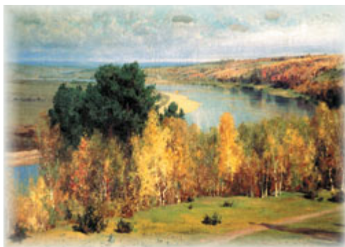
В. Поленов. Золотая осень