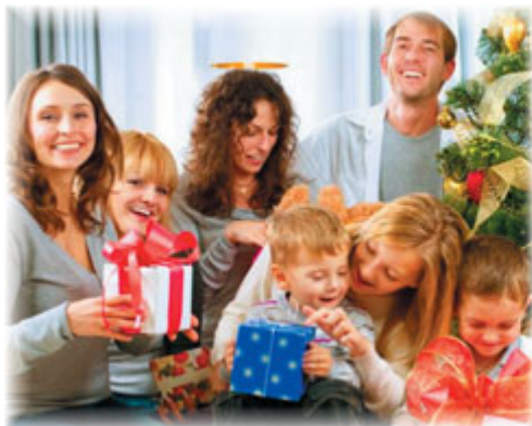
Встречаем Новый год

В. Напиши небольшое сочинение на тему «Событие в семье» (пять-шесть предложений). Можешь использовать одну из фотоиллюстраций.