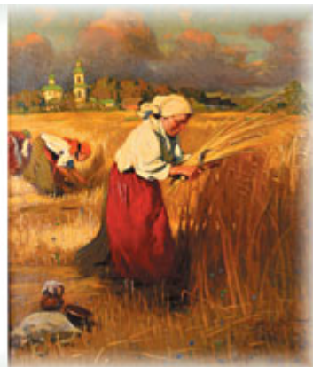
А. Маковский. Жатва. Труд

370. Проверь себя! А. Составь список главных слов урока.