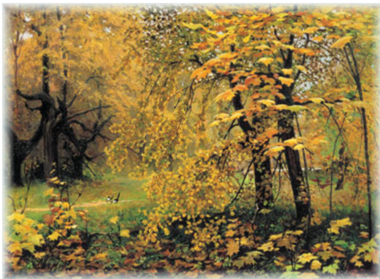
И. Остроухов. Золотая осень

Рассмотри репродукцию картины И. Остроухова «Золотая осень». Как ты считаешь, может ли она быть иллюстрацией к данному тексту? Аргументируй свою точку зрения.