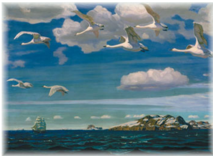
А. Рылов. В голубом просторе

в) «Что может рассказать Солнце?». Обязательно используй эпитеты, сравнения, метафоры. Можешь воспользоваться репродукцией картины А. Рылова «В голубом просторе».