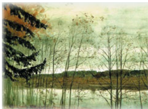
И. Левитан. Осень

Прочитай. Описанием какой репродукции могут быть эти стихотворные строки?