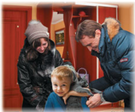
Новый член семьи