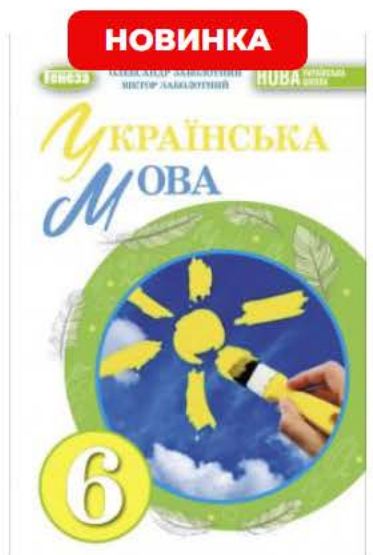
Українська мова. Підручник для 6 класу - Заболотний О.В.