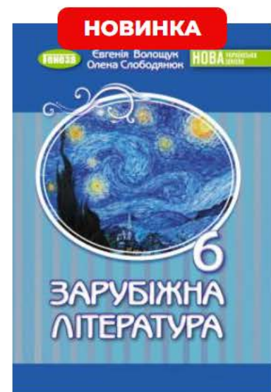
Зарубіжна література. Підручник для 6 класу - Волощук Є.В.