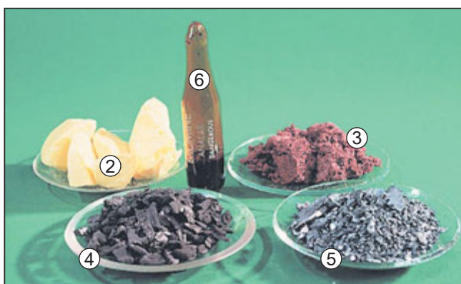
Рис. 12.3. Неметали. 1. Силіцій Si. 2. Сірка S 8 . 3. Червоний фосфор P. 4. Графіт C. 5. Йод I 2 . 6. Бром Br 2 – неметал, який за звичайних умов є рідиною. Пригадайте з курсу природознавства, які неметали є головними складниками повітря (за потреби використайте дані таблиці в Додатка). Опишіть їхні властивості.