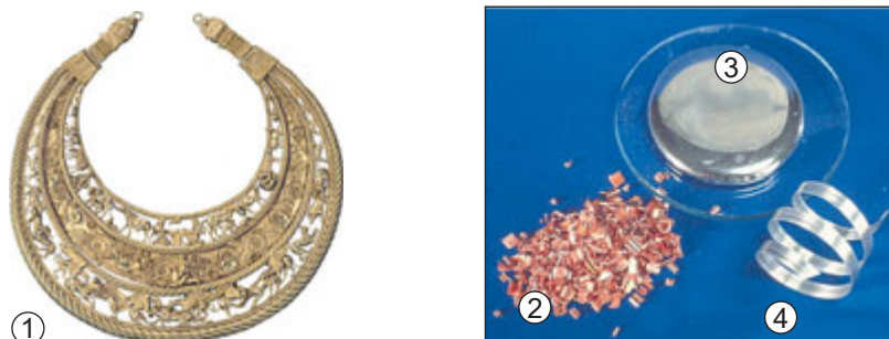
Рис. 12.2. Метали. 1. Пектораль із Товстої могили – нагрудна прикраса скіфського царя (IV століття до н. е.). Матеріал – золото Au. 2. Мідь Cu – метал, відомий людству з давніх-давен. 3. Ртуть Hg – один з небагатьох металів, які за звичайних умов є рідинами. 4. Магній Mg – сріблясто-білий пластичний метал