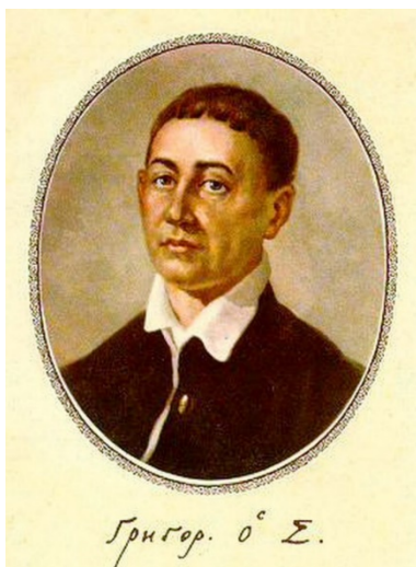
Портрет Григорія Сковороди. Невідомий художник. Друга половина 18 ст.