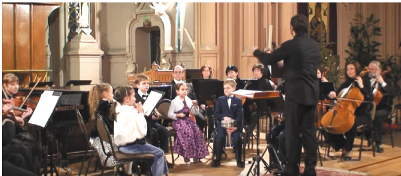
Леопольд Моцарт (Йозеф Гайдн). Симфонія іграшок, або Дитяча симфонія.

Який загальний характер симфонії? Як змінюється темп музики в кожній із частин?