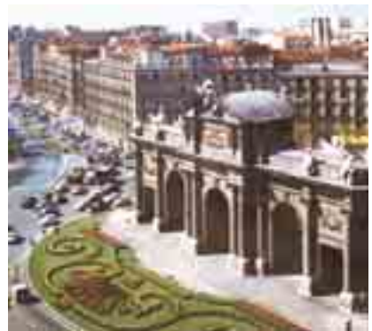
La Puerta de Alcalá

Real. También le encantan las plazas y calles: la Puerta del Sol, la Plaza Mayor, la Plaza de España, la calle de Gran Vía, la calle de Alcalá. Artem pasea mucho por las plazas y calles de Madrid. Él visita la corrida de toros. Le impresiona mucho este espectáculo.