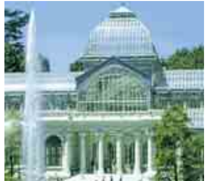
El Parque del Retiro