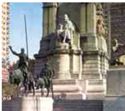
La Plaza de España