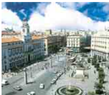
La Puerta del Sol

No lejos de la Puerta del Sol se encuentra la Plaza Mayor, un lugar de descanso muy favorito para los madrileños y turistas.