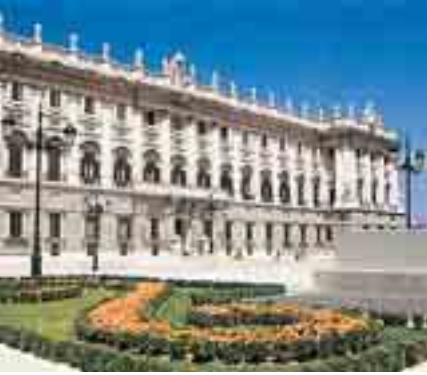
El Palacio Real