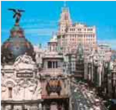
La calle de Gran Vía