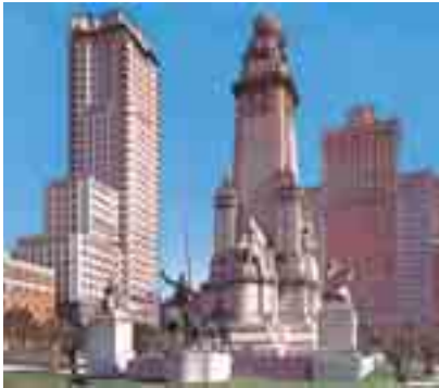
La Plaza de España