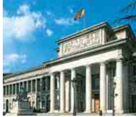
El Museo del Prado

En la zona central de Madrid se encuentran muchos lugares de interés: el Palacio Real, el Museo del Prado, la Plaza de España con el monumento a Cervantes y a sus Don Quijote y Sancho Panza, el Parque del Retiro, etcétera.